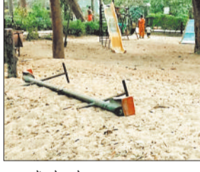
उद्यान में टूटे झूले।

शिवरीनारायण। नगर के प्रमुख मनोरंजन स्थल नेहरु बाल उद्यान में प्रतिदिन नगर सहित आसपास क्षेत्रों से बड़ी संख्या में लोग यहां घूमने और बच्चों को मनोरंजन के लिए लेकर पहुंचते हैं, लेकिन ■ टूटी झूले, बंद फव्वारे और अत्यवस्थित हरियाली से प्रभावित हो रही छवि उद्यान में कई मूलभूत सुविधाओं की कमी और रखरखाव के अभाव से लोगों को निराशा हो रही है। स्थानीय लोगों का कहना है कि उद्यान में साफ-सफाई तो की जाती है, लेकिन जिस स्तर पर नियमित देखरेख और मेंटेनेंस होना चाहिए, वह नहीं हो पा रहा है। पेड़-पौधों की समय-समय पर कटाई-छंटाई नहीं होने से हरियाली अत्यवस्थित हो गई है। कई स्थानों पर अनावश्यक झाड़ियां और पौधे उग आए हैं, जिससे उद्यान की सुंदरता प्रभावित