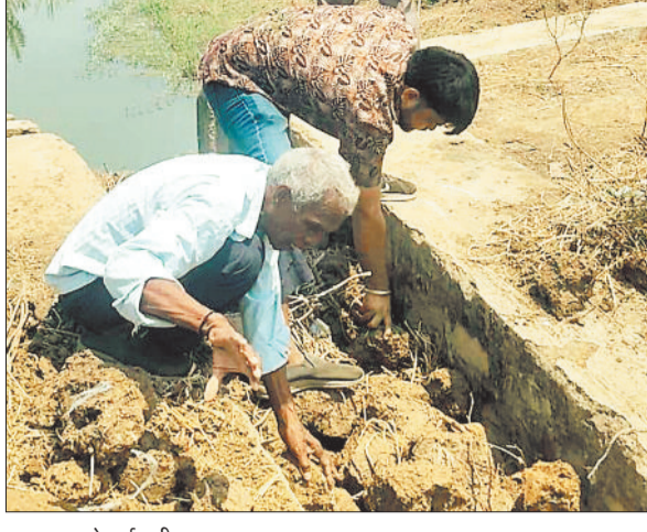
श्रमदान करते वाईवासी।

परिवहन करती है, वह जिम्मेदारी से बच रही है। पीडीएस दुकान संचालक कभी खाद्य अधिकारी से बात करने को कहता है, तो खाद्य अधिकारी वितरणकर्ता को बोलने की बात कहते हैं। इस तरह जिम्मेदारी एक-दूसरे पर डालकर मामला टाला जा रहा है, जबकि इसका सीधा नुकसान आम जनता को उठाना पड़ रहा है। एक दुकान संचालक ने यह भी बताया कि वितरणकर्ता का तर्क है कि उसकी बड़ी गाड़ी नगर की संकीरी गलियों में नहीं आ सकती और छोटी गाड़ी कहीं फंसी हुई है। जबकि हकीकत यह है कि वैकल्पिक व्यवस्था कर छोटी गाड़ियों से भी राशन पहुंचाया जा सकता है। साफ तौर पर यह खाद्य विभाग और वितरण एजेंसी की उदासीनता को दर्शाता है। एक ओर सरकार द्वारा पीडीएस व्यवस्था को मजबूत करने और गरीबों तक समय पर राशन पहुंचाने के लिए नई-नई योजनाएं लागू की जा रही हैं, वहीं स्थानीय स्तर पर व्यवस्था दुरुस्त नहीं हो चलते हितग्राहियों की दिक्कतें बढ़ गई हैं। लोगों ने प्रशासन से मांग की है कि तत्काल चावल वितरण शुरू कराया जाए ताकि हितग्राहियों को समय पर उचित मूल्य दुकान से राशन मिल सके।