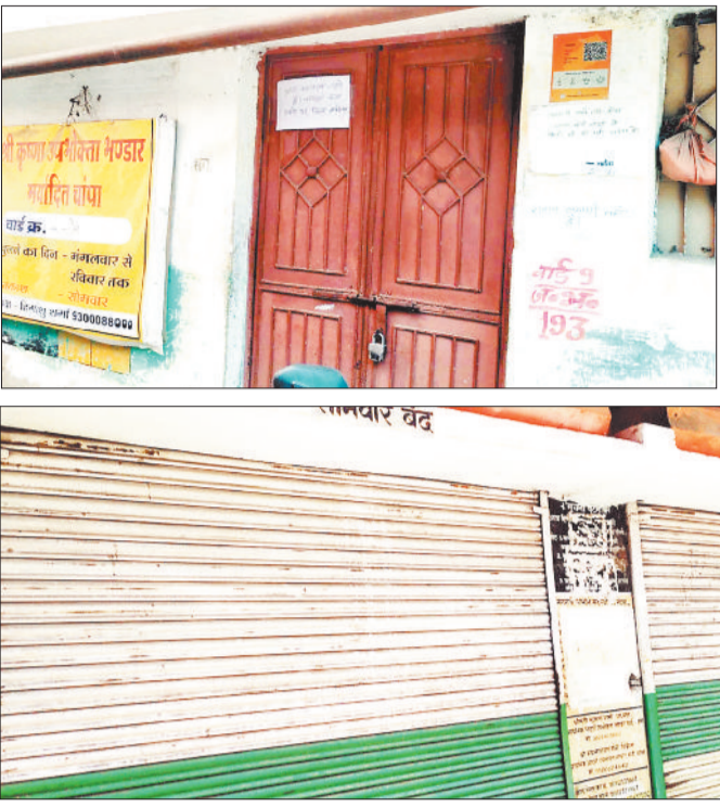
शासकीय उचित मूल्य दुकान में लगा ताला।

हरिभूमि न्यूज चांपा शहर की लगभग 7 शासकीय उचित मूल्य दुकानों में बीते 3 से 4 दिनों से चावल का वितरण पूरी तरह बंद है, जिससे गरीब और मध्यम वर्गीय परिवारों को भारी परेशानी का सामना करना पड़ रहा है। रोजाना पीडीएस दुकान पहुंचने के बावजूद हितग्राहियों को खाली हाथ लौटना पड़ रहा है। ज्ञात हो कि शासन द्वारा इस माह पीडीएस दुकानों के माध्यम से उपभोक्ताओं को तीन महीने का चावल एक मुश्त दिया जा रहा है, जिसके कारण दुकानों में हितग्राहियों की भारी भीड़ देखी जा रही है। वहीं समय कम होने के कारण लोग बड़ी संख्या में चावल लेने दुकान पहुंच रहे हैं, लेकिन विडंबना यह है कि शहर के बरछा पारा, मठ मंदिर क्षेत्र, हजारी गली, मंझली तालाब, महादेव घाट, सोनार पारा सहित कई इलाकों की राशन दुकानों में चावल उपलब्ध नहीं है, जिसके कारण उपभोक्ताओं की परेशानी बढ़ गई है। उन्हें बिना राशन लिए ही बैरंग लौटना पड़ रहा है। एक सोसायटी संचालक ने बताया कि अधिकारियों को समस्या की जानकारी दी गई है, लेकिन इसके